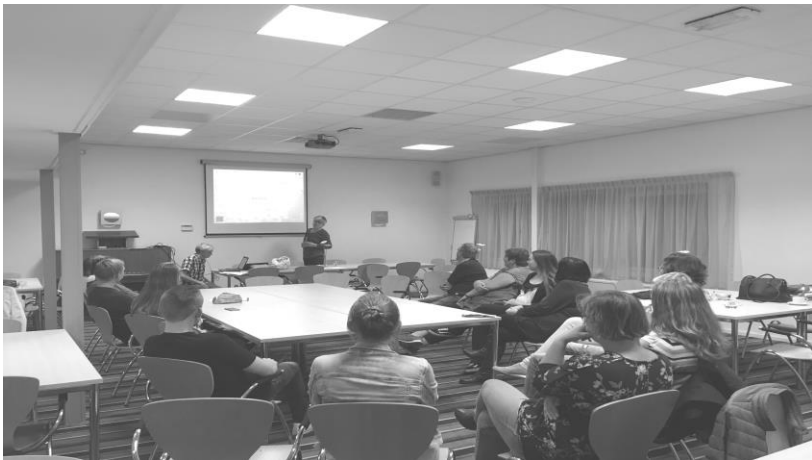
Foto bijeenkomst over de Roemeniëreis